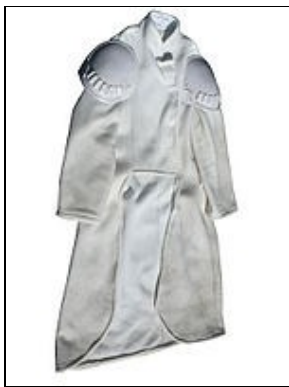
Duster For 501st approval: