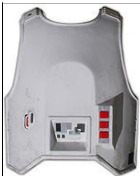
Plastron For 501st approval: