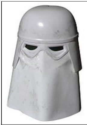
Casque For 501st approval:

Les composants de costumes suivants doivent être présents et apparaître comme décrit ci-dessous pour l'approbation.