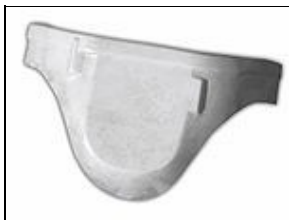
Codpiece For 501st approval: