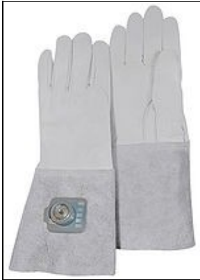
Gants For 501st approval: