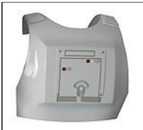
Armure Dorsale For 501st approval: