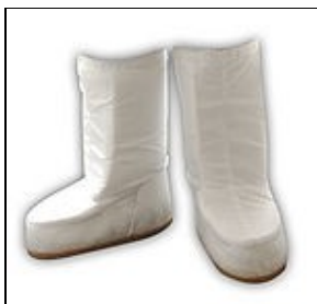
Bottes For 501st approval: