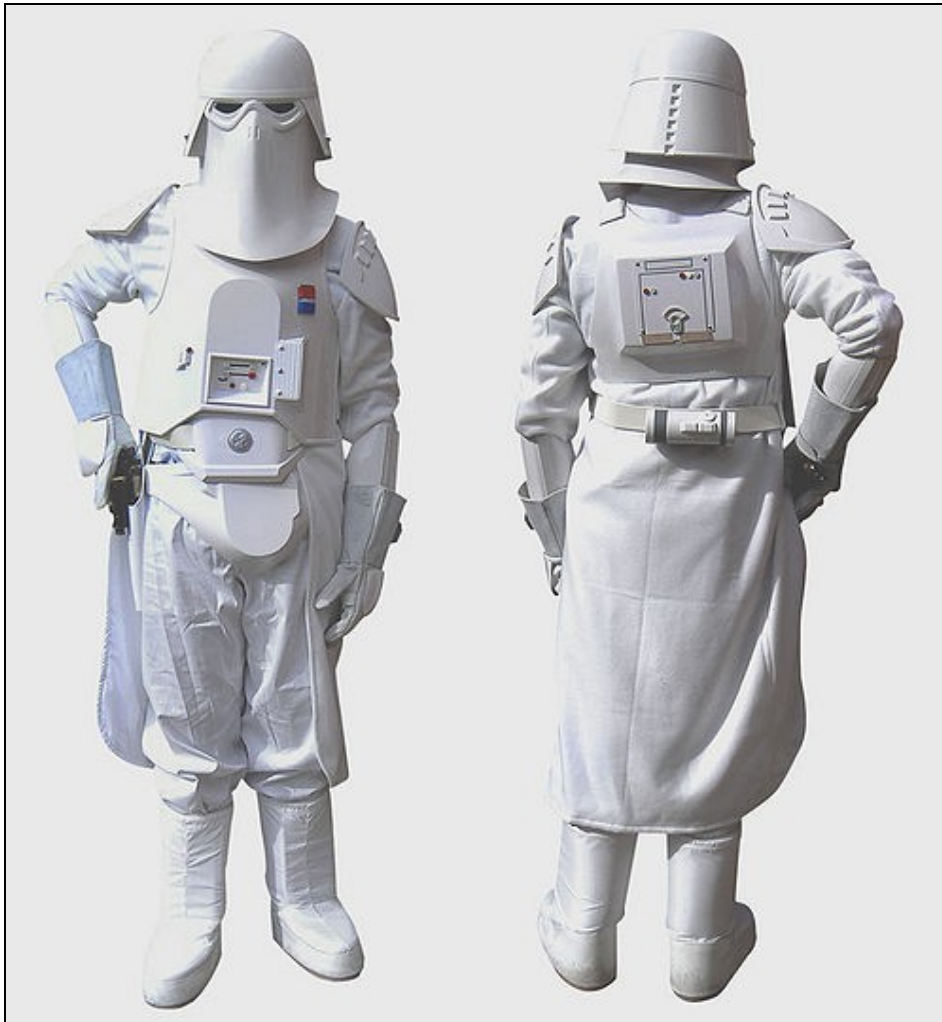
Modèle Snow Trooper Commandant