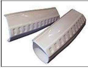
Plaques de mains For 501st approval: