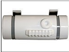
Détonateur For 501st approval: