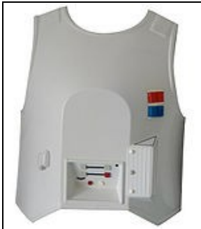
Plastron For 501st approval: