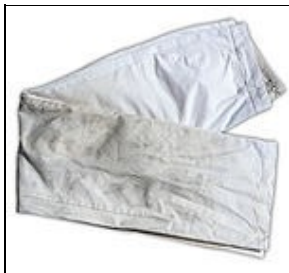
Pantalon For 501st approval: