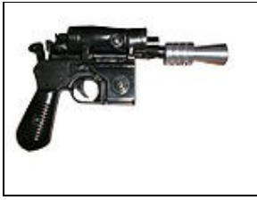
DL-44 Blaster pistolet For 501st approval:

Fabriqué par BlasTech Industries, le DL-44 Blaster a la capacité de charger un coup de feu plus lourd, presque deux fois plus puissante que les pistolets semblables. Parce que le blaster est très modifiables et est l'un des rares blasters démontré qu'ils ont la capacité de pénétrer l'armure Impériale, l'Empire a imposé des restrictions lourdes sur ce modèle et dans de nombreux cas, la propriété est interdit en dehors des forces Impériales.