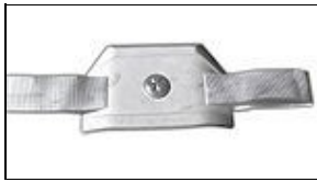
Plaqué AB / Boucle de ceinture For 501st approval: